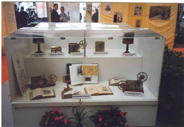
Présentation de matériels télégraphiques anciens, lors de la foire exposition de Poitiers en mai 1999.