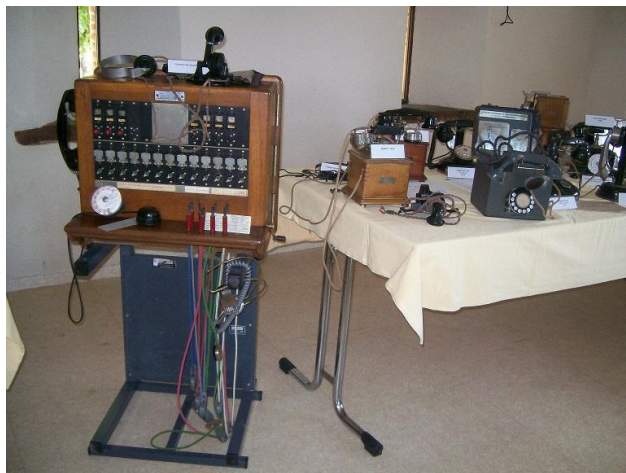
Août 2010 : vacances de ARHISTEL à Adriers