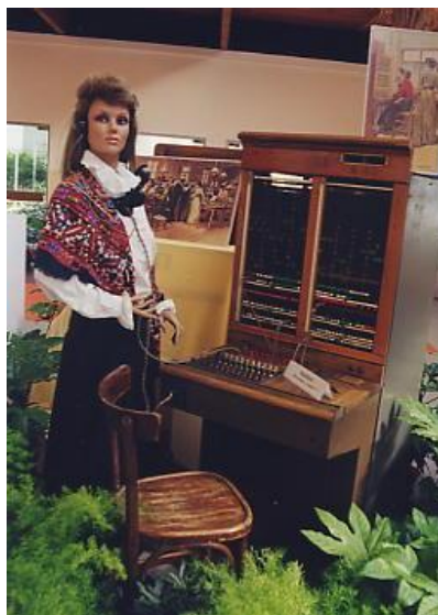
La Demoiselle du téléphone.