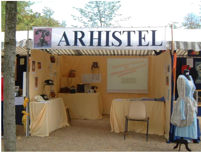
Journée des associations de Poitiers en 2004.