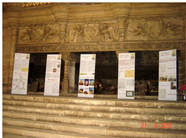
Le télégraphe Chappe présenté au palais de justice de Poitiers lors des journées du patrimoine en 2007.